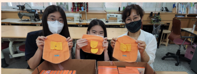
동아리 및 봉사 프로그램