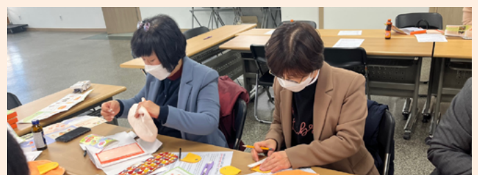
학부모 연수 프로그램